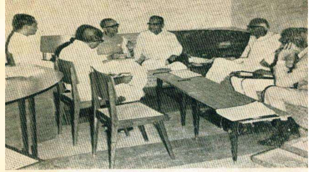
दक्षिण गुजरात युनिवर्सिटीने ઉપક્રમે મળેલી રાજ્યની યુનિવર્સિટીઓના કુલપતિઓની સભાની તસ્वीર