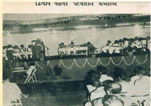
દ્વિતાય વાર્ષિક પદ્ધતિદાન સમારંભ